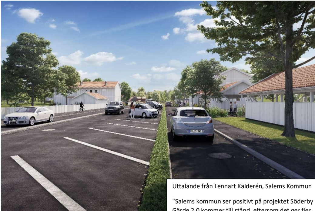
Bild på hur ny infart genom området skulle kunna gestaltas.